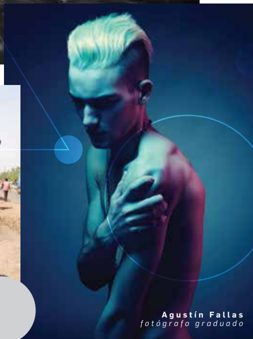
Agustín Fallas fotógrafo graduado