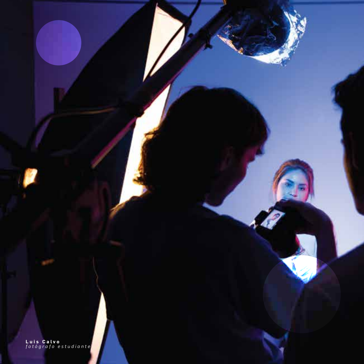
Luis Calvo fotógrafo estudiante