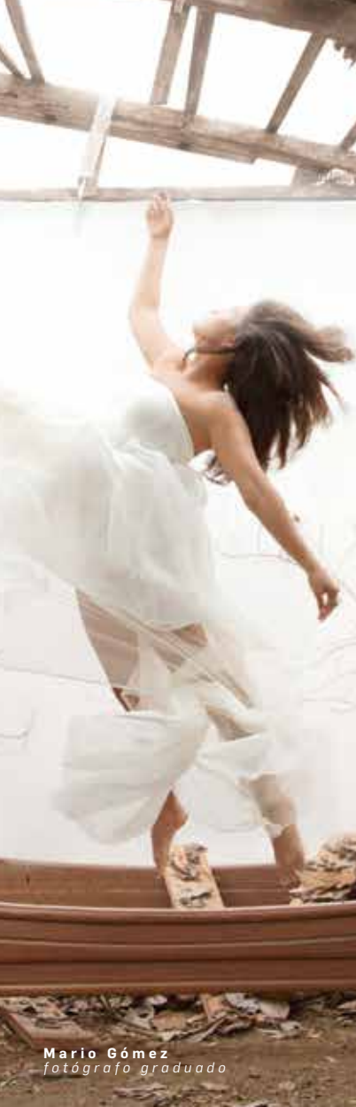
Mario Gómez fotógrafo graduado