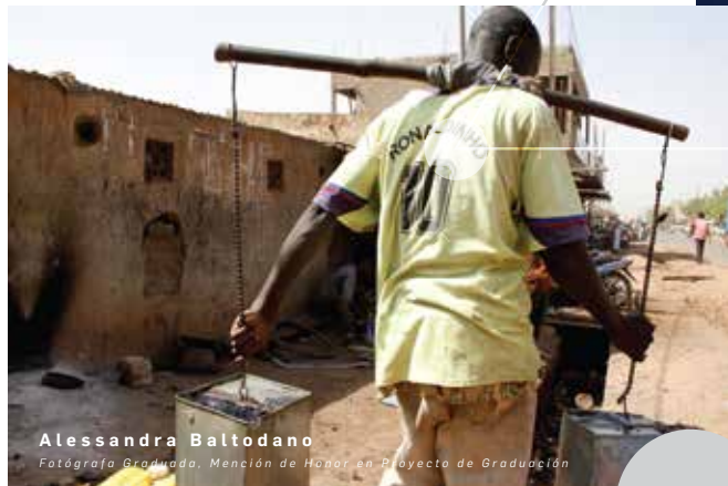
Alessandra Baltodano Fotógrafa Graduada, Mención de Honor en Proyecto de Graduación